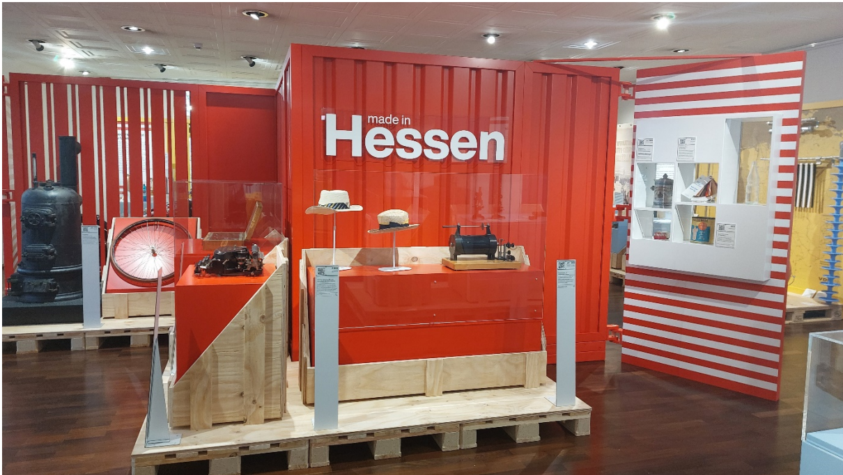
Die Ausstellungsinsel "Kaleidoskop der Champions" führt über QR-Codes zur Website